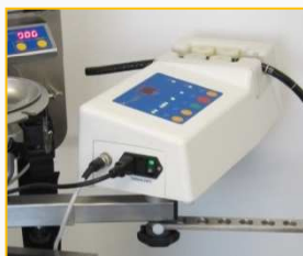
Befestigung für endo drive®