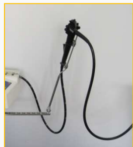
Griffhalter für Endoskop – im Bedarfsfall sind die Hände nicht am Endoskop gebunden