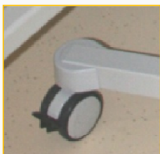
Arretierbare Lenkrollen für einfache Positionierung des Komplettsystems