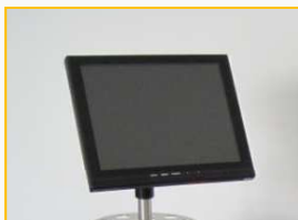
Kontrollmonitor und Videoaufzeichnung der Rückspiegelphase