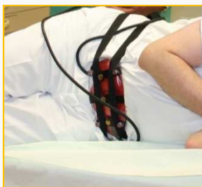
Bauchkompressionskissen mit Zwei-Kammer-System

Als Ergänzung und Komfortabilität kann das Funktionsstativ bequem von einem Stehhocker aus bedient werden.