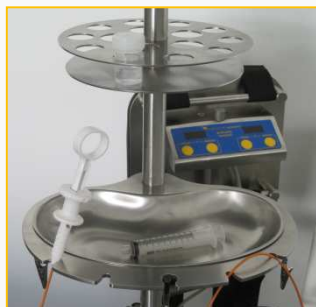
Biopsie-Tablett mit Gefäß-Rondell