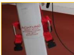
Gurte zur Fixierung am Bettgestell