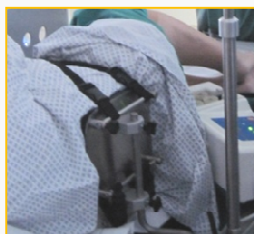
Rückenstütze und Gurtsystem